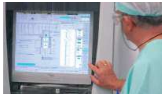
PROCESOS INDUSTRIALES INTEGRADOS