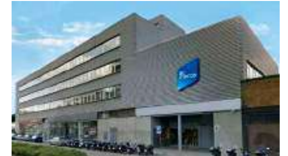
EDIFICIO SEDE CENTRAL, BARCELONA

Grupo internacional , con sede en Barcelona, cuenta con 12 filiales propias, más de 1000 empleados y presencia de sus marcas en más de 50 países.