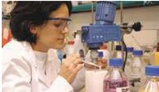
EN LA VANGUARDIA DE LA INVESTIGACIÓN